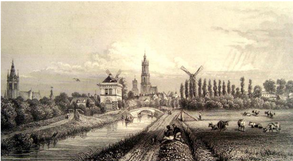
Gezicht op Delft, gezien vanaf Den Hoorn langs de Buitenwatersloot