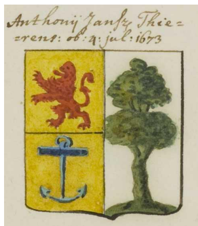
Anthonij Jansz. Thierens 4