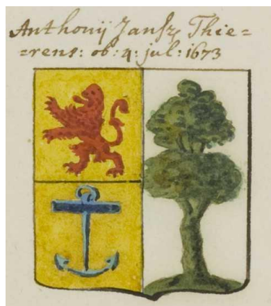
Anthonij Jansz. Thierens 4