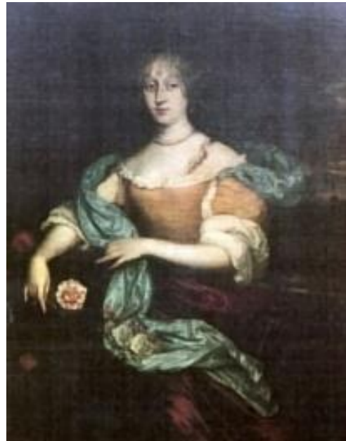
Afb. 6 Catharina Francsdr. van der Goes Collectie Museum Prinsenhof Delft, in bruikleen van Stichting van Vredenburg.