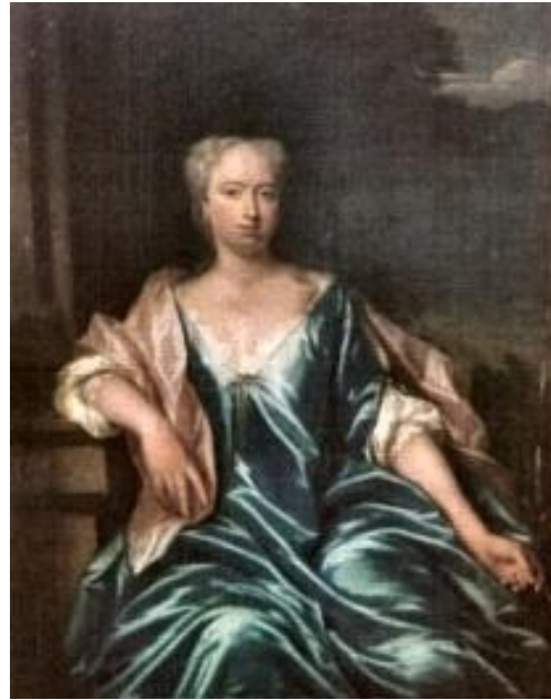
Agatha Corvina van der Dussen Collectie Colectie Museum Prinsenhof Delft, in bruikleen van Stichting van Vredenburch.